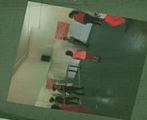
LA COSTITUZIONE CHE DIVENTA COREOGRAFIA