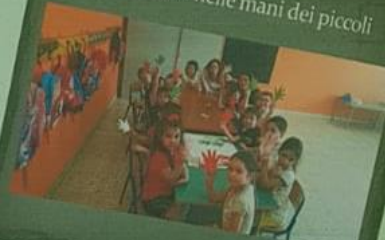
La Costituzione nelle mani dei piccoli