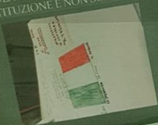
SCUOLA VIVA MODULO COSTITUZIONE E NON SOLO CARTA