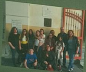
VISITA CON L'ASSESSORE PRESSO IL COMUNE