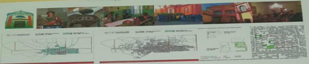
IL TEMPO E LA MEMORIA "TERRAE CASALIS PRINCIPIS" - ANNO 1758 LA MAPPA DELL'AREA PIU' ANTICA DELLA CITTA'