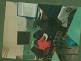
LAVORI DI GRUPPO