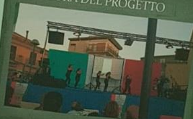
CHIUSURA DEL PROGETTO