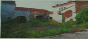
INTELLIGENZA CIVILE (C.A. CASALE) - CASALE MONFERRATO