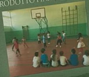
IL PRODOTTO FINALE