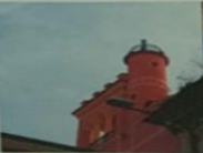
INTELLIGENZA CIVILE (C.A. CASALE) - CASALE MONFERRATO