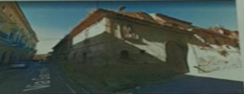
INTELLIGENZA CIVILE (C.A. CASALE) - CASALE MONFERRATO